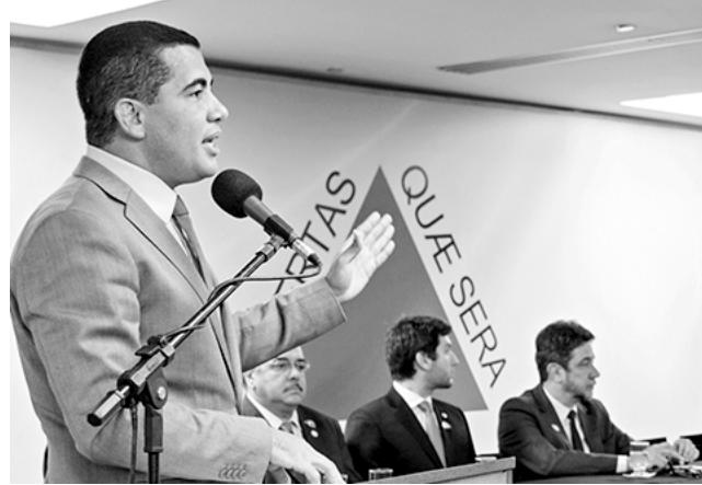
Estado fomenta empreendedorismo nas universidades

O Governo de Minas Gerais, por meio da Secretaria de Estado de Desenvolvimento Econômico, Ciência, Tecnologia e Ensino Superior (Sedectes) e o Programa Minas Digital, acaba de dar mais um passo na ampliação do ecossistema empreendedor mineiro. Foi publicado o edital e estão abertas as inscrições para o programa Startup Universitário, que vai incentivar o desenvolvimento do ecossistema de inovação nas instituições de ensino superior (IES) públicas e privadas do estado.