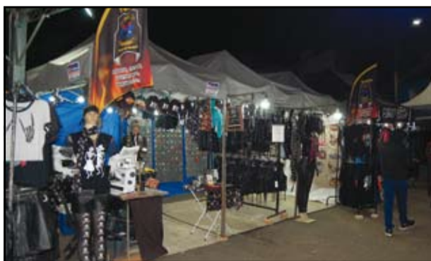
Barracas com produtos para motociclistas