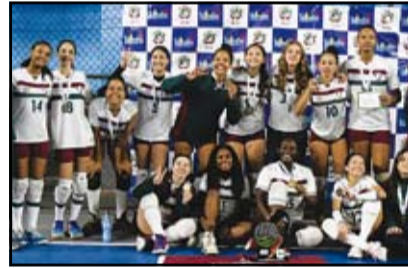
Fluminense - Sub 15