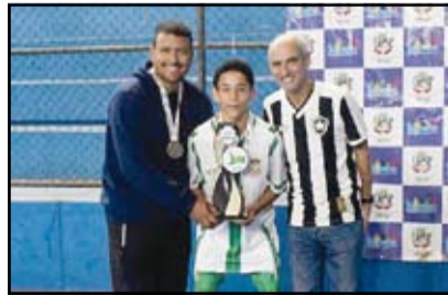
Seritinga - Sub 15