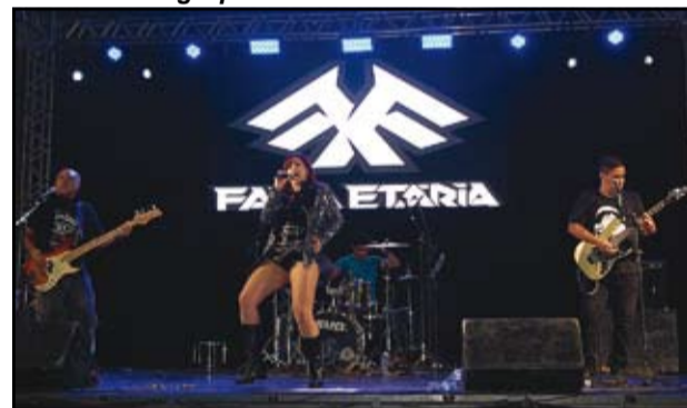
Show com a banda Faixa Etária