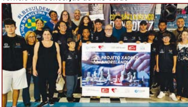
Torneio em Conceição do Rio Verde