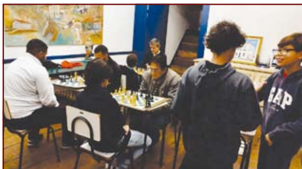
Inauguração do Clube de Xadrez em Andrelândia

Com a inauguração do Clube de Xadrez e o sucesso nos torneios regionais, Andrelândia está rapidamente se firmando como um centro de excelência no xadrez, atraindo atenção e respeito no cenário esportivo do Sul de Minas.