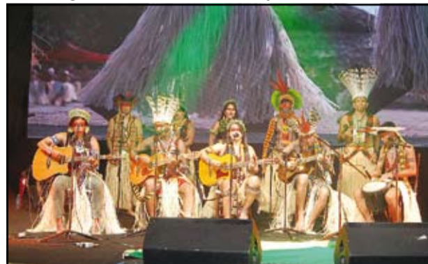
Participações Culturais abrilhantaram o Salão do Turismo