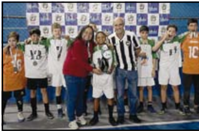
Seritinga - Sub 13