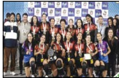
Pedra de Guaratiba - Sub 17