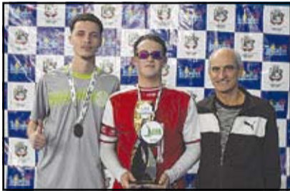
Arantina - Sub 17