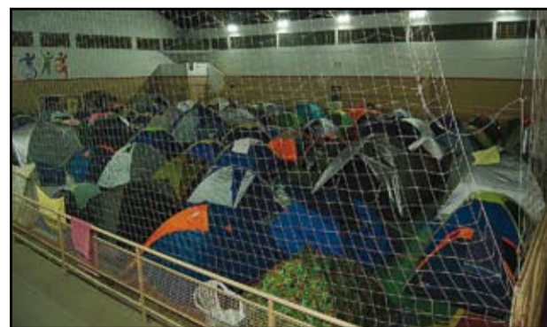
Além das pousadas a quadra ficou repleta de barracas