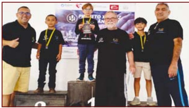
Torneio em Andrelândia