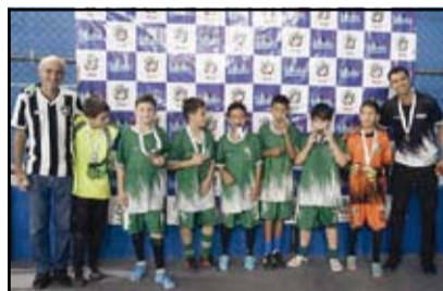
Passa Vinte - Sub 11