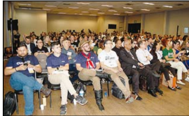
Salão Nacional do Turismo no Rio de Janeiro reúne Ministério do Turismo, Secretarias de Estado de Turismo, Instâncias de Governança Regionais e Circuitos Turísticos para o lançamento do Plano Nacional de Turismo 2024/2027