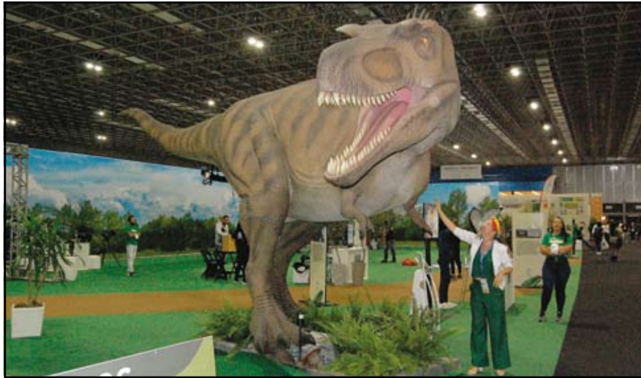
Terra dos Dinos, parque temático dedicado a história dos dinossauros no Rio de Janeiro