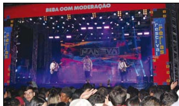
Show com o grupo Maneva

O 38º Festival de Férias de Andrelândia, com seu novo formato, provou ser um grande sucesso, agradando tanto os moradores quanto os visitantes. A cidade já começa a se preparar para a próxima edição, com a expectativa de que o evento cresça ainda mais e continue surpreendendo. Que no próximo ano tenha muito mais!