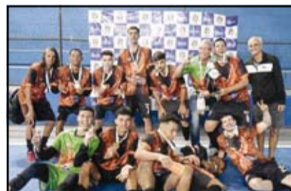
Rio Preto - Adulto