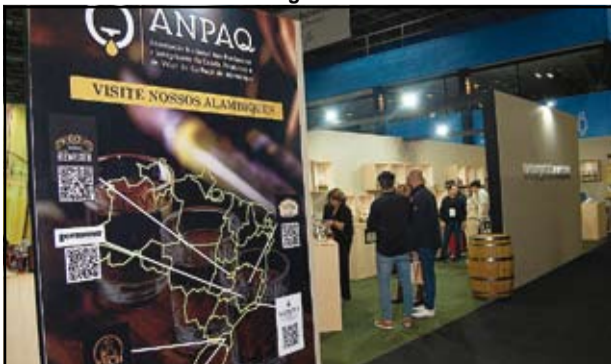
Estande da Associação Nacional de Produtores de Cachaça