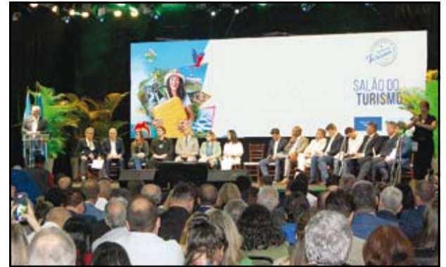
Abertura oficial pelo vice-presidente Geraldo Alckmin