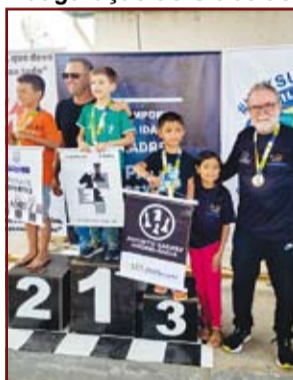
Torneio em Conceição do Rio Verde