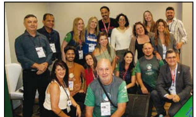
FECITUR - Federação dos Circuitos Turísticos de Minas Gerais