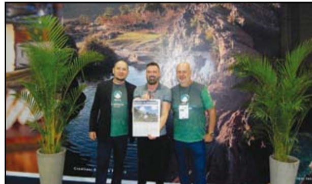
Secretário de Turismo de Minas, Leônidas Oliveira, recebe caderno de turismo do Circuito Montanhas Mágicas no estande da Secult-MG

sustentável e promovem o desenvolvimento econômico local. O evento reforçou a importância da colaboração e do diálogo contínuo entre as diferentes regiões do país para fortalecer o turismo nacional.