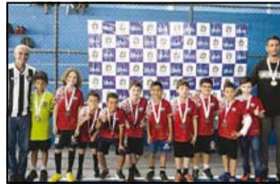
Bom Jardim de Minas - Sub 09