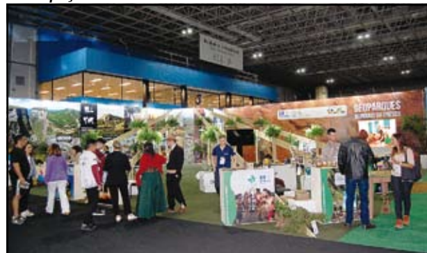
Estande dos Geoparques da Unesco no Brasil