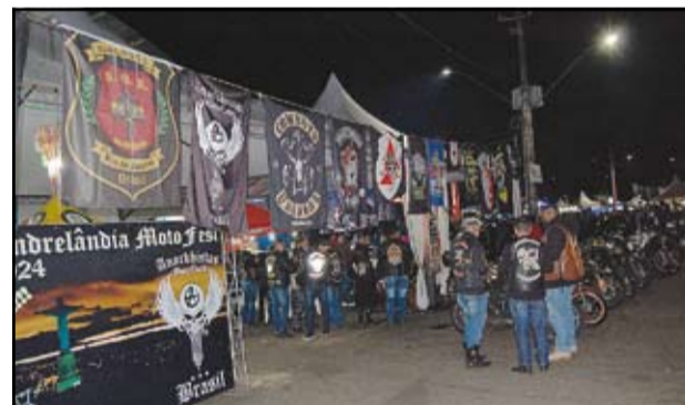
Motoclubes e suas bandeiras