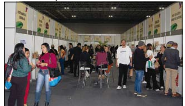
Armazém da Agricultura Familiar reuniu estandes de todo o Brasil