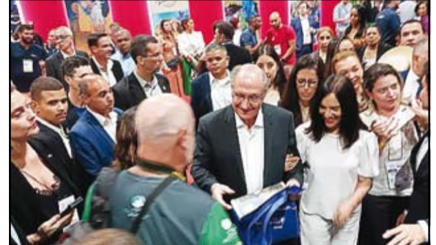
Vice-presidente Geraldo Alckmin recebe caderno de turismo do Circuito Montanhas Mágicas da Mantiqueira