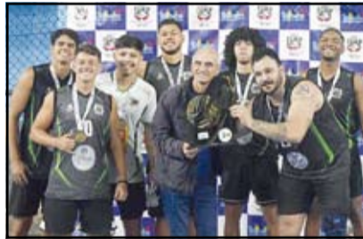
Açores - Adulto Masculino