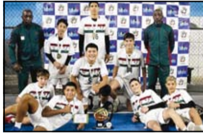
Fluminense - Sub 15