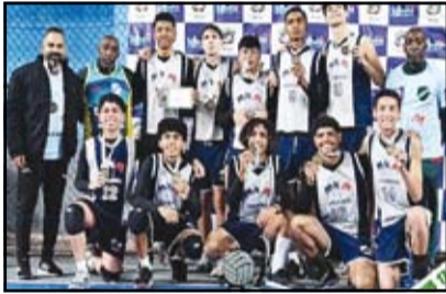
M M Voleibol RJ - Sub 17