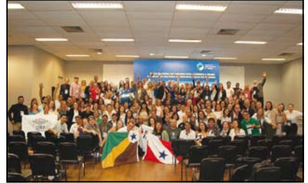
Seminário de Turismo com as IGRs/Circuitos Turísticos