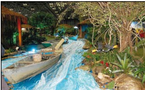
Estande do Pantanal de Matogrossense