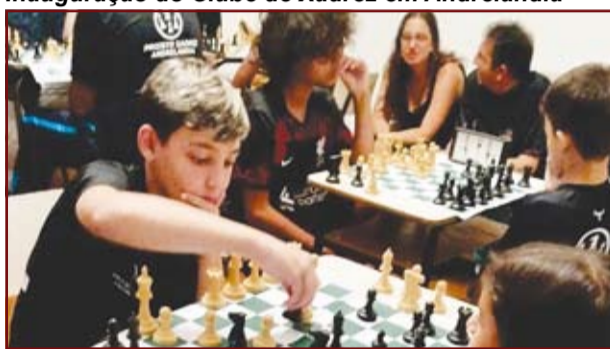
Inauguração do Clube de Xadrez em Andrelândia