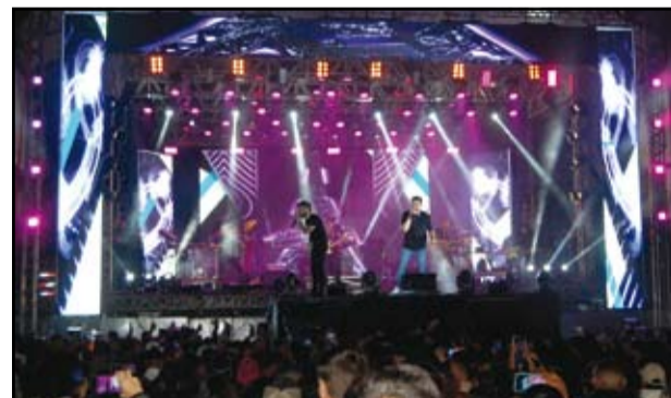
Show com Guilherme & Benuto