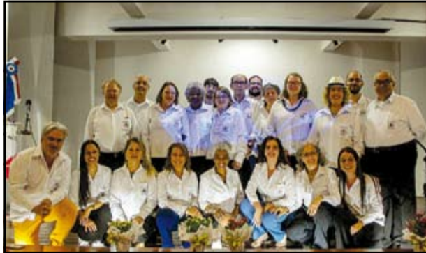
Grupo Literário Fonte das Letras