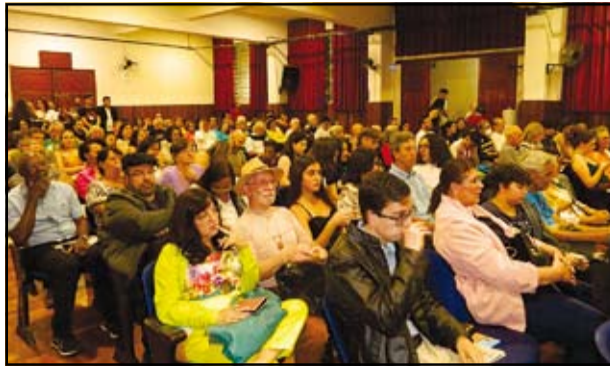
O V Encontro do Fonte das Letras celebrou o Tempo

E já fica o convite: em 2025, estaremos juntos novamente, com mais experiência e novas ideias, prontos para mais uma noite inesquecível!