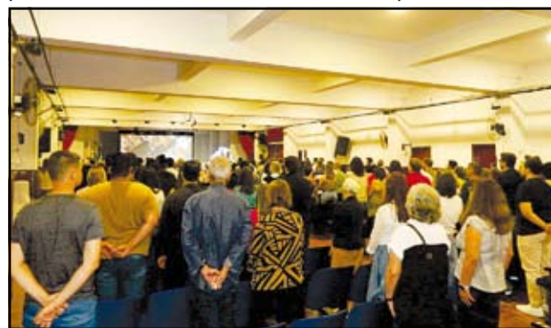
O Encontro recebeu um público bem diversificado