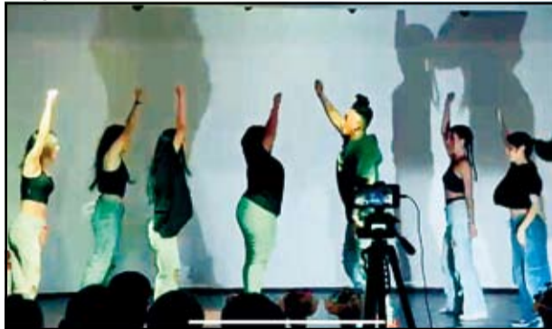
Cia New Star dançou o tempo com belas coreografias