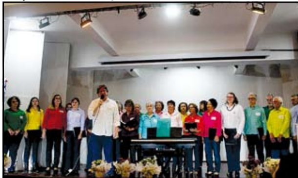
Coral por Amor passou pelo tempo com sutileza e amor