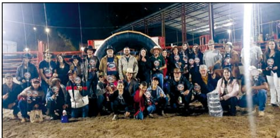
Prêmiação do Torneio

Na sequência, aconteceu a 2ª etapa do Rodeio, retomando as competições na arena às 21h. A noite terminou em clima festivo