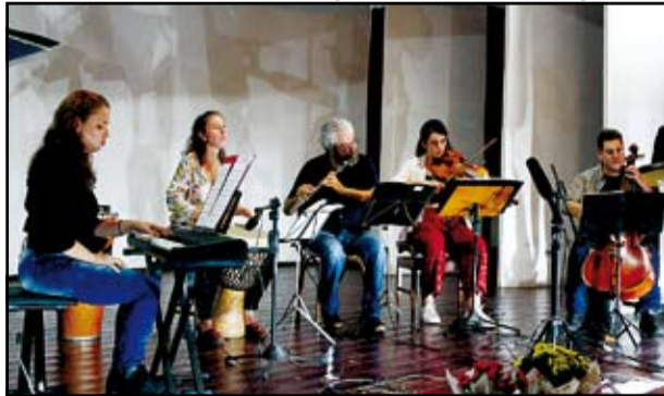
Grupo Musical Estação Choro