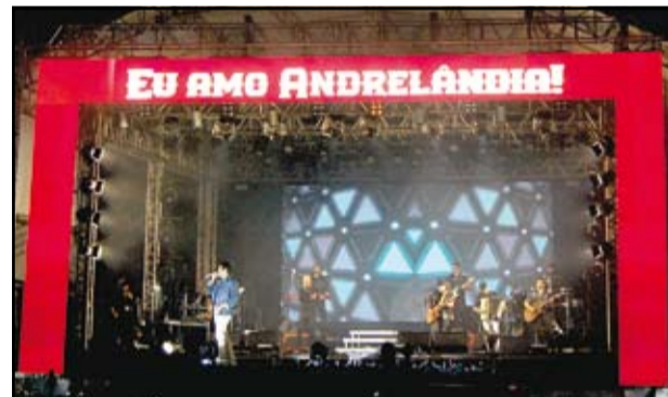
Show com Matheus & Kauan