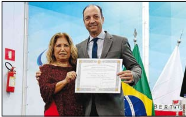
Ney da Saúde