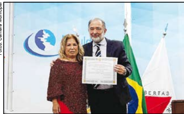
Prefeito Walter José Lessa