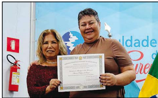
Alcione Protetora dos Animais