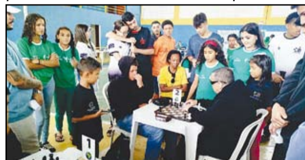
Observe a atenção dos presentes assistindo a partida, jogada com tabuleiro adaptado.